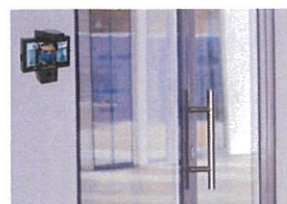
三脚なしで壁面への取付も可能(要配線)