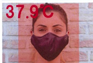
音声『基準を超えています』