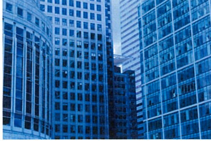
■商業ビル、オフィスの出入口